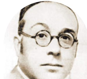
Manuel García Morente (1886-1942)

Filósofo y pedagogo rodero (Málaga), fundador, entre otros, de la Institución Libre de Enseñanza (1876). La ILE propició la renovación cultural y pedagógica de la educación.