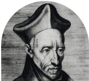
Francisco Suárez (1548-1617)

Desde un punto de vista filosófico, esta riqueza queda plasmada en un nutrido grupo de pensadores y pensadoras que, a lo largo de la historia, han contribuido al desarrollo de nuestra disciplina. Así, caben destacar figuras como las de Séneca, Averroes, Maimónides, Francisco Suárez, Francisco Giner de los Ríos, Manuel García Morente o María Zambrano , entre otras muchas.