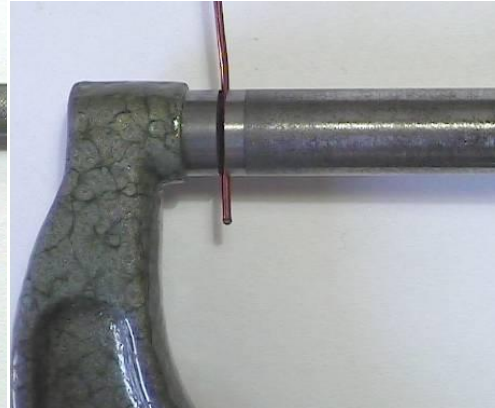
Detalle de medida con micrómetro