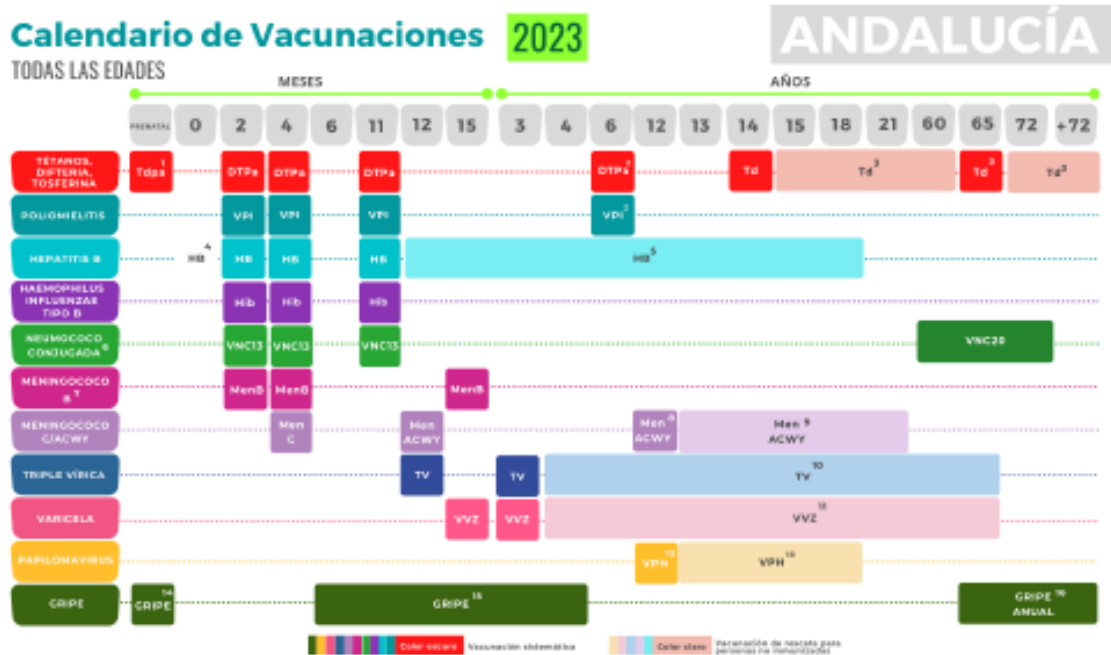
Tabla 1 Calendario de vacunaciones recomendado para todas las edades, Andalucía 2023 – versión 2