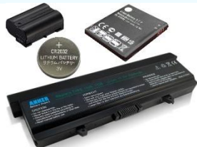
Baterías y acumuladores.