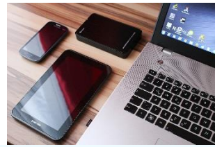
Ordenadores de sobremesa, portátiles, tablets, smartphones, e-readers, teclados y ratones.