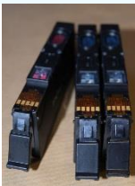
Cartuchos de impresión con partes eléctricas.