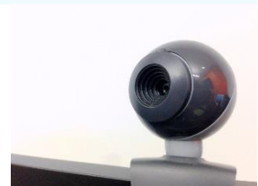
Cámaras de vídeo y webcams.

Los aparatos eléctricos y electrónicos (AEE), y entre ellos los aparatos informáticos, deben ir identificados con el símbolo que se identifica a continuación, el cual indica la necesaria recogida separada del aparato una vez que éste ha pasado a transformarse en residuo. Deberá ser visible, legible e indeleble, y se trata de un contenedor de basura tachado con un aspa.