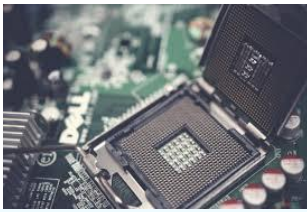
Circuitos, tarjetas y placas base.