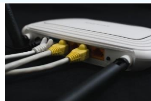
Switches, routers y antenas.