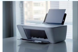
Impresoras, faxes y escáneres.