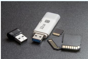
Pendrives, dispositivos bluetooth y tarjetas de memoria.