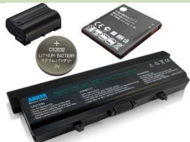
Baterías y acumuladores.