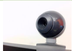
Cámaras de vídeo y webcams.

Los aparatos eléctricos y electrónicos (AEE), y entre ellos los aparatos informáticos, deben ir identificados con el símbolo que se identifica a continuación, el cual indica la necesaria recogida separada del aparato una vez que éste ha pasado a transformarse en residuo. Deberá ser visible, legible e indeleble, y se trata de un contenedor de basura tachado con un aspa.