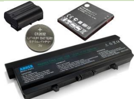
Baterías y acumuladores.